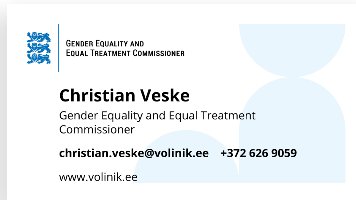
TAGAKÜLG - ENG