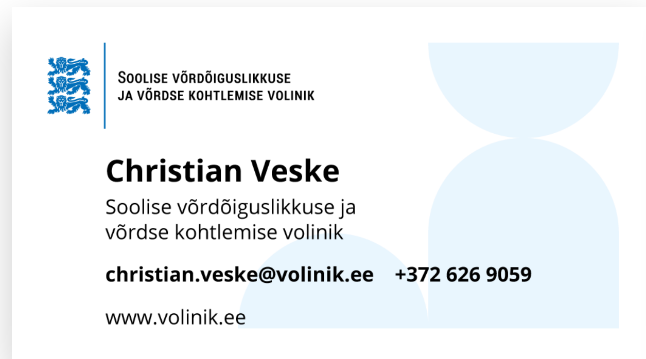
ESIKÜLG - EST

Visiitkaart on 90x50 mm ja kahepoolne. Esiküljel on info eestikeeles ja tagaküljel inglisekeeles. Eestikeelsel küljel kohtlakk trükiga punktkiri.